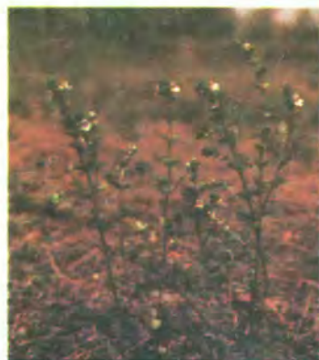
173. Очанка коротковолоса.